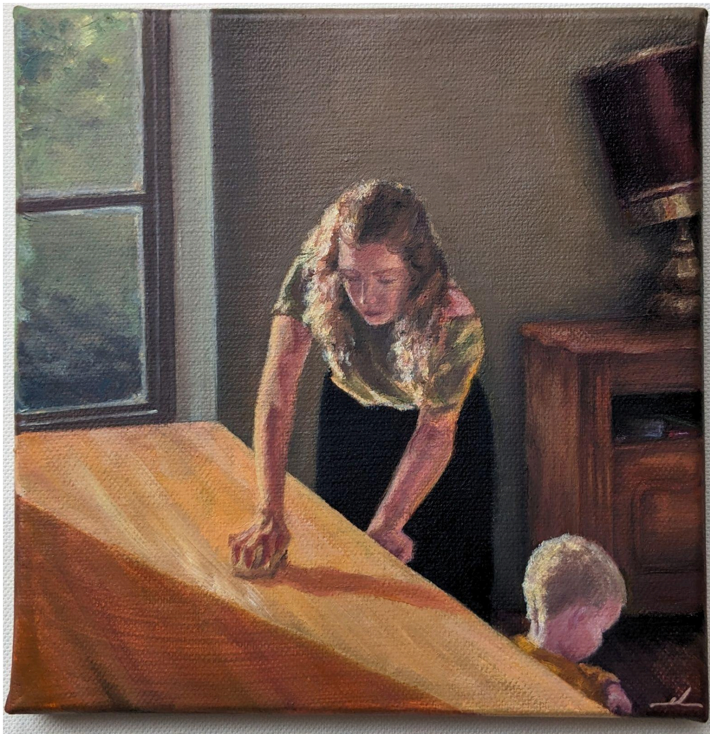
Anonyme - Peinture à l'huile